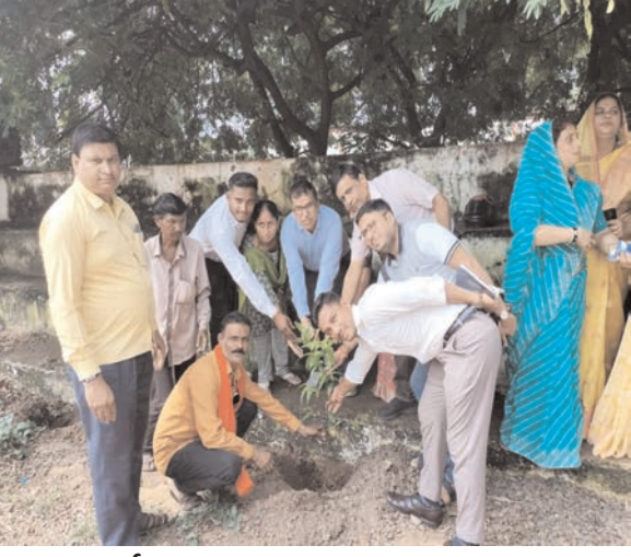
इन्द्राण दर्पण जबलपुर