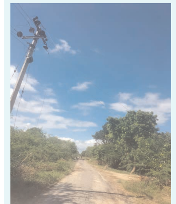
रुद्रांश दर्पण मैनपुरी नगला रामलाल और देवकली में सड़क के बीच-बीच से 11000 की लाइन के तार लटक रहे। बार-बार सभी से शिकायत करने के बाद भी लाइनमैन तार नहीं जोड़ रहे हैं, लाइनमैन गांव के लोगों से लाइन जोड़ने के लिए पैसे मांग रहे हैं, लाइनमैन और अधिकारियों की घोर लापरवाही से कभी भी एक बड़ा हादसा हो सकता है।