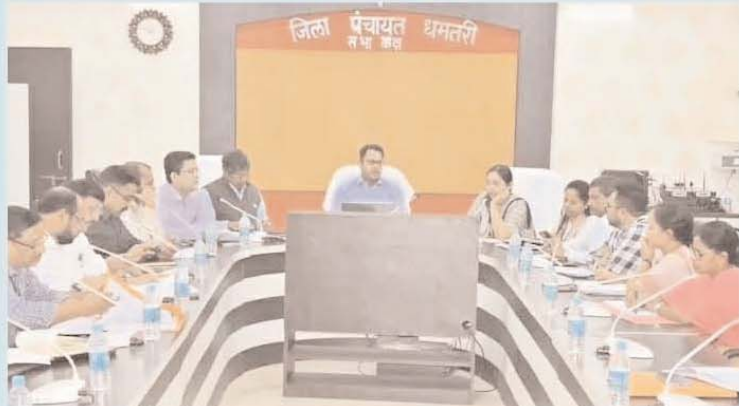
धमतरी। कलेक्टर एवं जिला निर्वाचन अधिकारी श्री ऋतुराज रघुवंशी ने मतदान के पूर्व नोटल और रिटर्निंग अधिकारियों की ली समीक्षा बैठक। विधानसभा निर्वाचन के कार्य को स्वतंत्र, निष्पक्ष एवं निर्विघ्न रूप से संपन्न कराने हेतु सभी व्यवस्थाएँ सुनिश्चित कराने के लिए निर्देश दिए।