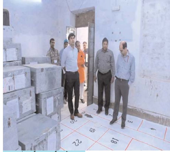
रुद्रांश दर्पण-सवाई माधोपुर

ईवीएम एवं वीवीपेट मशीनों को मतदान के लिए किया जा रहा तैयार