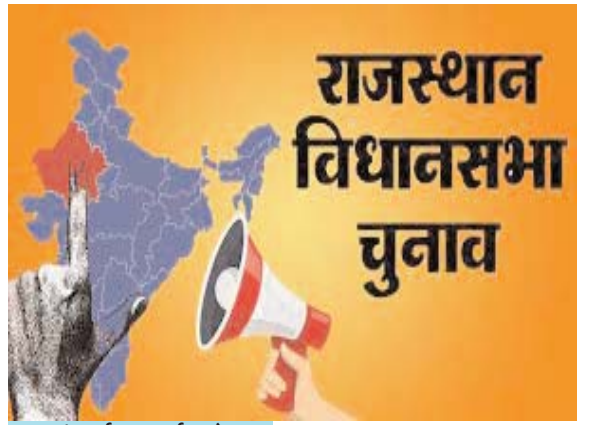
रुद्रांश दर्पण-सवाई माधोपुर

भारत निर्वाचन आयोग के निर्देशानुसार मतदान दिवस 25 नवंबर, 2023 को मतदाताओं की शत-प्रतिशत भागीदारी सुनिश्चित करने के उद्देश्य से सतरंगी सप्ताह मनाया जा रहा है।